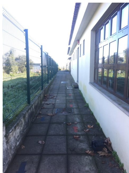
Zonas envolventes ao edifício escolar – proposta de repavimentação global