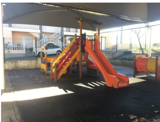
Proposta de substituição de pavimento de borracha

A proposta prevê a substituição do pavimento de borracha existente com a área de 80,00m 2 e a criação de um pequeno campo de jogos a nascente do edifício em base cimentícia, revestido a resina acrílica e protegido com vedação para o efeito numa área aproximada de 60,00m 2 .