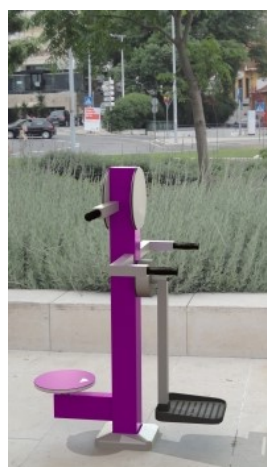
Cintura e Surf K FIT 35