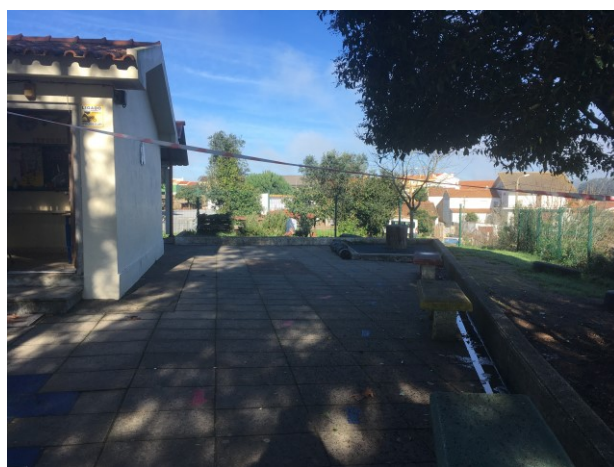
Zona a criar campo de jogos

Por se tratar de uma obra de requalificação total do logradouro , serão ainda intervencionadas as zonas envolventes ao edifício , que apresentam alguns sinais de degradação propondo-se a sua requalificação , nomeadamente muros e muretes, vedações e portões, canaletes , substituição das tampas de betão e colocação de bebedouros, ecopontos e requalificação de bancos .