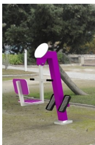
Balança K FIT 01

A correria dos pais e adultos que rodeiam as crianças e jovens no seu dia-a-dia, leva a que, na perspectiva de afirmar a segurança associada ao lazer, o seu crescimento seja amarrado às novas tecnologias, aprisionando-os num mundo só deles. A contrariar esta tendência e dando ênfase à prática de exercício é proposto a linha "Veco, Urban Design, Kids Fitness" , ou equivalente, cumprindo com a norma europeia EN166630:2015 , que vem proporcionar/orientar as crianças para um estilo de vida saudável, física e mentalmente.